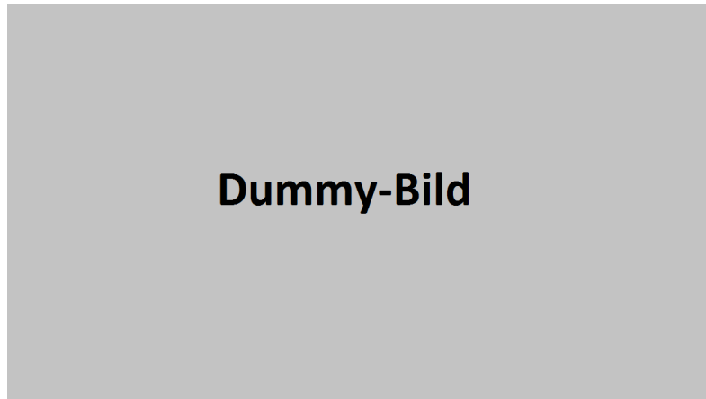
Abbildung 3: Handout zum Admin-Frontend